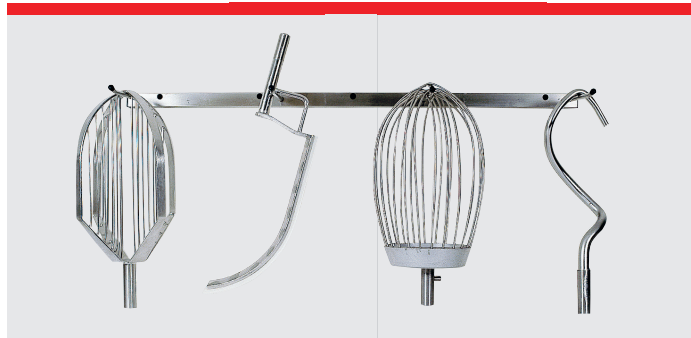
Porte-outils, 91 cm