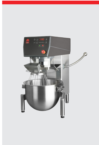
Version marine, modèle de table 20 L