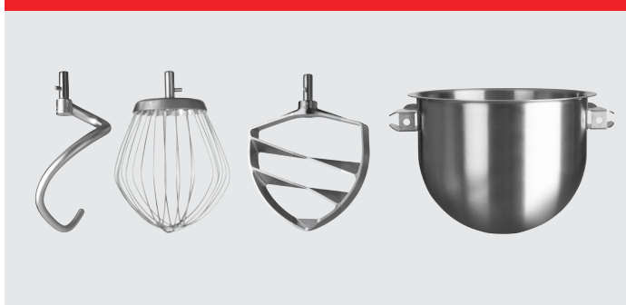
Crochet, fouet, palette et cuve 20 L en acier inoxydable.