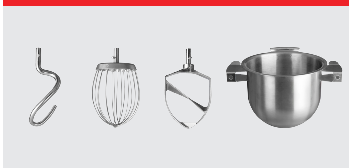
Crochet, fouet, palette et cuve 20/12 L en acier inoxydable.