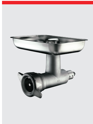
Hachoir à viande, 82 mm