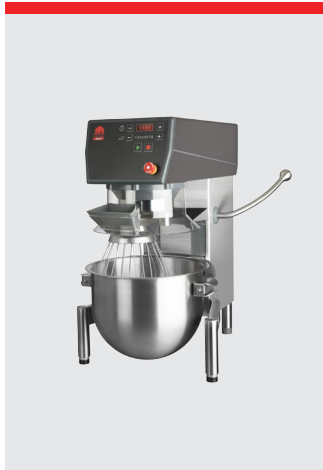
Acier inoxydable, modèle de table 20 L