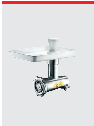
Hachoir à viande, 70 mm