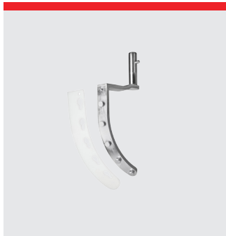
Racleur automatique, acier inoxydable. Lame en téflon ou en nylon. 20 L et 20/12 L.